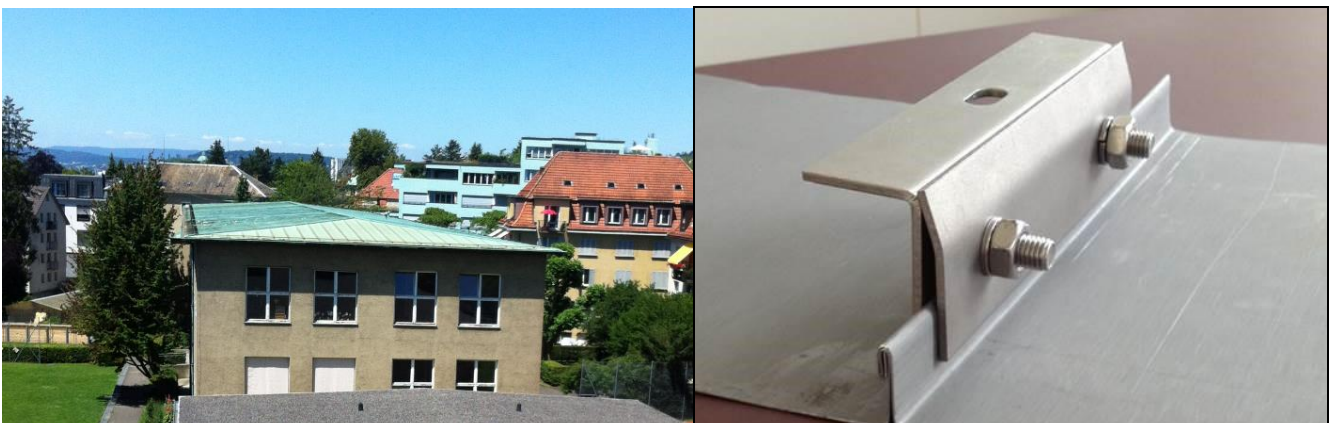
Abb. 2: Einfache und kostengünstige Befestigung des Solardaches von Energie Solaire SA auf dem Blechfalzdach

Die Montage der Solarabsorber kann mit Klemmen-Montage auf dem Falzdach sehr einfach und kostengünstig realisiert werden: