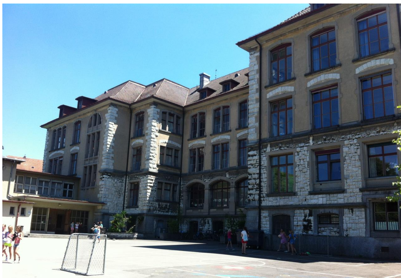
Abb. 1: Denkmalgeschütztes Schulhaus Hofacker in 8032 Zürich, das künftig mit einer Erdsonden-Wärmepumpe beheizt werden soll. Die Erdwärmesonden sollen dabei zu 100% solar regeneriert werden.